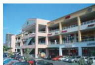
フォレストモール南大沢

全国のフォレストモールで催事スペースをご用意しております。(施設名をクリックしてご参照ください。)