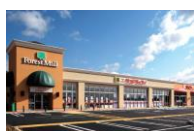
フォレストモール岡谷