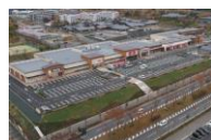
フォレストモール木津川