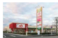
フォレストモール八王子大和田

●全ての催事場は屋外にございます。●会場のご予約はお申込み日の翌月末まで承っております。また抽選申込期間と一般申込期間を設けております。(抽選申込期間) 毎月第1月曜日から当週の金曜日までに、上述の「お問い合わせフォーム」またはお電話・メール等でお申込みください。翌週の火曜日を目標に担当者より結果をお知らせ致します。(一般申込期間) 抽選申込期間以降、会場に空きがある場合にご予約を承らせて頂きます。●備品(机・椅子他)は施主様にてお持ち込みください。●備品の事前発送等の受付(現地でお受取り・保管)は致しかねます。施設内店舗でも対応致しかねますので当日にご持参ください。●発生したごみは全て施主様にてお持ち帰りください。●施設内に出店している店舗で取り扱いのある商品や類似する商品を取り扱う場合は、ご出店をお断りさせて頂く場合がございます。またそれ以外の場合でも当施設に相応しくないと弊社にて判断した場合は、ご出店をお断りさせて頂く場合がございます。●「催事出店申込書」及び「催事場使用確認書」記載事項に違反した場合、会場使用許可を取り消させていただきます。尚、使用許可取消に伴う損害等については、弊社は一切の責任を負いません。