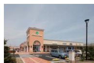
フォレストモール新前橋