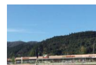
フォレストモール仙台茂庭