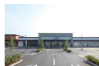
フォレストモール甲斐竜王