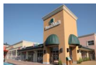
フォレストモール富士河口湖