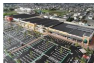
フォレストモール石岡