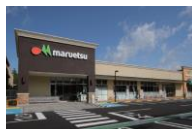
フォレストモール伊西牧の原