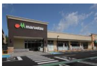
フォレストモール伊豆西牧の原