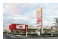
フォレストモール八王子大和田