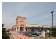
フォレストモール新前橋