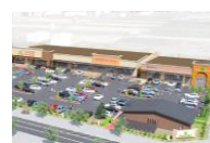
フォレストモール佐久平