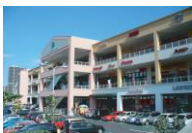
フォレストモール南大沢

全国のフォレストモールで催事スペースをご用意しております。(クリックすると各施設ホームページに移動します)