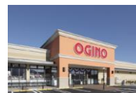
フォレストモール富士川