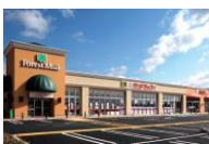
フォレストモール岡谷