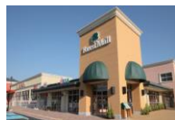
フォレストモール富士河口湖