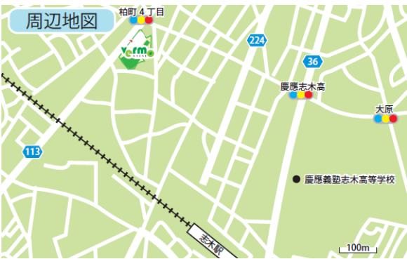
東武東上線「志木」駅より徒歩8分

使用料 平日: 11,000円/日 (税込) 土日祝: 22,000円/日 電源 有り