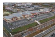
フォレストモール木津川