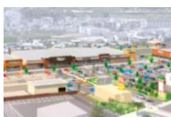
フォレストモール岩出