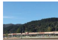
フォレストモール仙台茂庭