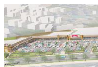
フォレストモール京田辺

●全ての催事場は屋外にございます。●会場のご予約はお申込み日の翌月末まで承っております。また抽選申込期間と一般申込期間を設けております。(抽選申込期間) 毎月第1月曜日から当週の金曜日までに、上述の「お問い合わせフォーム」またはお電話・メール等でお申込みください。翌週の火曜日を目的地に担当者より結果をお知らせ致します。(一般申込期間) 抽選申込期間以降、会場に空きがある場合にご予約を承らせて頂きます。●備品(机・椅子他)は施主様にてお持ち込みください。●備品の事前発送等の受付(現地でのお受取り・保管)は致しかねます。施設内店舗でも対応致しかねますので当日にご持参ください。●発生したごみは全て施主様にてお持ち帰りください。●施設内に出入している店舗で取り扱いのある商品や類似する商品を取り扱う場合は、ご出店をお断りさせて頂く場合がございます。またそれ以外の場合でも当施設に相応しくないと弊社にて判断した場合は、ご出店をお断りさせて頂く場合がございます。●「催事出店申込書」及び「催事場使用確認書」記載事項に違反した場合、会場使用許可を取り消させていただきます。尚、使用許可取消に伴う損害等については、弊社は一切の責任を負いません。